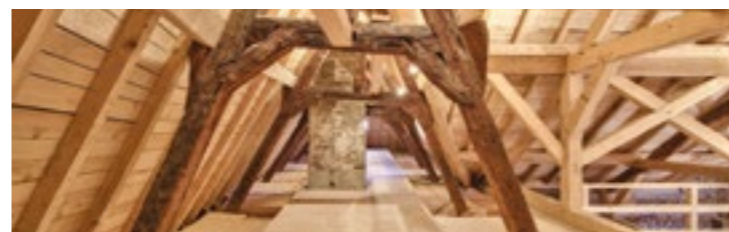
Photo : Annecy, visite famille

Les adultes sont acceptés uniquement accompagnés par des enfants. Nombre limité à 25 personnes. Entrée dans la limite des places disponibles. Renseignement au 04 50 33 87 34 entre 9h et 12h (sauf le mercredi, samedi et dimanche) ou sur reservation.animations@annecycn.fr