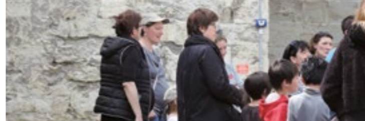
Photo : Annecy, visite

Mardi 8, 15, 22 et 29 mai à 14h30 Jeu 3, 10, 17, 24 et 31 mai à 14h30 Sam 5, 12, 19 et 26 mai à 14h30